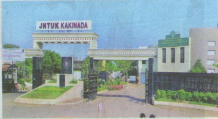
JNTU in Kakinada

According to university registrar VV Subba Rao, in view of demise of former Prime Minister Atal Bihari Vajpayee and due to the weeklong mourning, it was decided to postpone the celebrations. The registrar also announced that the new date of conduct of the programme will be announced later after fixing the date.